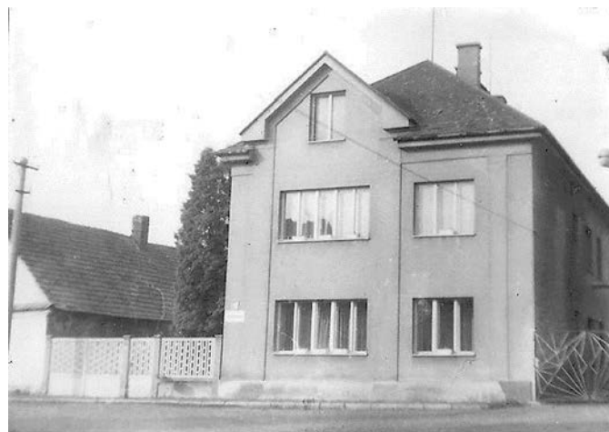
Benešova vila, nově budova MŠ v roce 1973

Ovšem, co je smutné, v roce 1996 došlo k úbytku dětí a v té krásné, velké školce je „jednotříd-