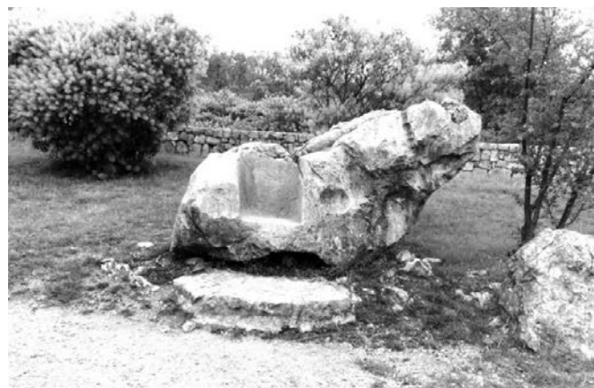
Při porovnání všech čtyř fotografií je jasné, jak vypadal Kras před válkou a sto let po ní!